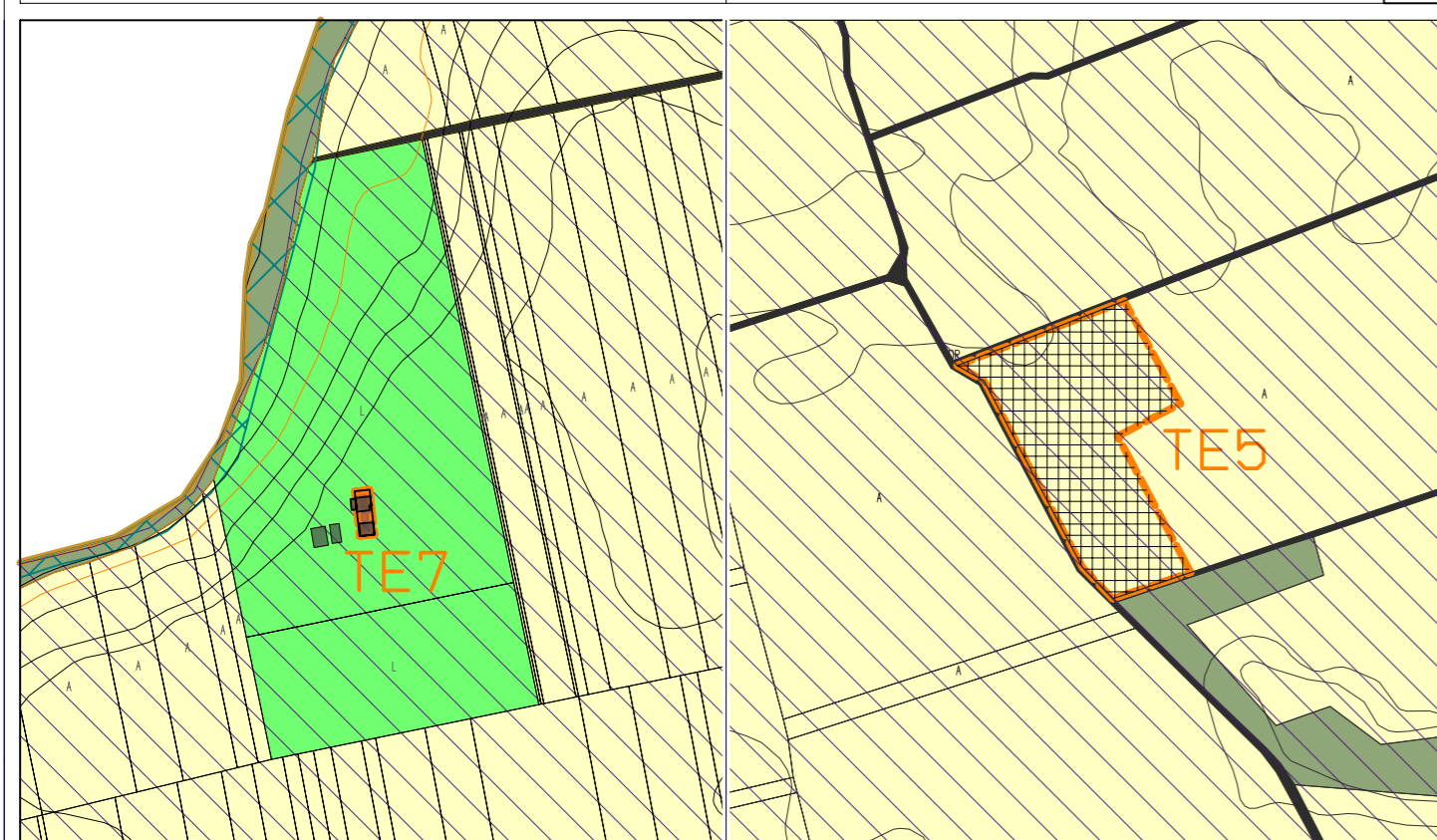
TRUP INTRAVILANL STABILIT PRIN PUZ- SEDIU FERMA (HCL 29/27.10.2006) 3 TRUP A3- STATIE EPURARE I PLATFORMA DEPOZITARE DESEURI MENAJERE (CONFORM PUG APROBAT) 2